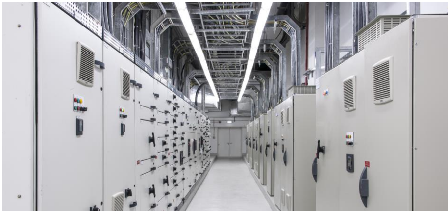
Bancos de capacitores