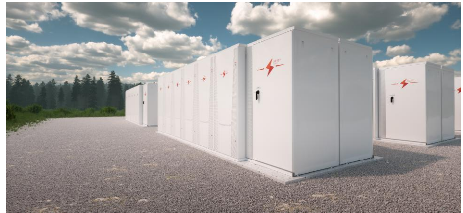
Almacenamiento de energía